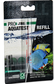
JBL PROAQUATEST K buisje