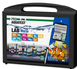
JBL PROAQUATEST LAB Marin Professionele testkoffer voor zeewateranalyse