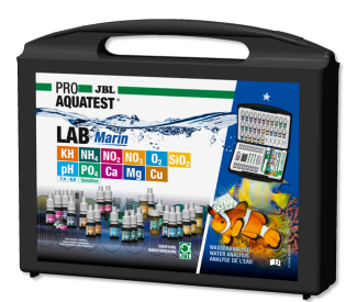
JBL PROAQUATEST LAB Marin Coffret professionnel d'analyse de l'eau de mer