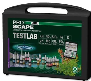
JBL PROAQUATEST LAB PROSCAPE Coffret d'analyse de l'eau en aquarium planté