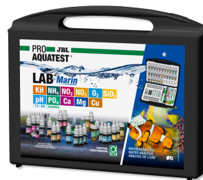
JBL PROAQUATEST LAB Marin Coffret professionnel d'analyse de l'eau de mer