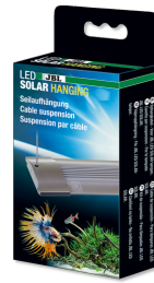
JBL LED SOLAR Hanging Seilaufhängung für JBL LED SOLAR Leuchten