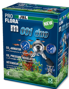
JBL PROFLORA m001 duo Détendeur pour 2 diffuseurs de CO2