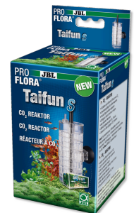
JBL PROFLORA Taifun S Uitbreidbare CO2-diffuser voor kleine aquaria