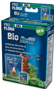
JBL PROFLORA BioRefill Navulset voor bio CO2- bestemmingsinstallaties