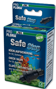
JBL PROFLORA SafeStop Waterterugloopbeveiliging voor CO2-systemen.