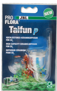
JBL PROFLORA Taifun P Mini CO2-diffuser voor zoetwater nano-aquaria