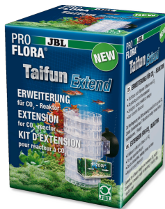
JBL PROFLORA Taifun Extend Uitbreiding voor geconcentreerde CO2- diffusiereactor.