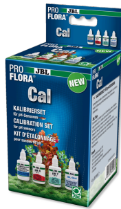
JBL PROFLORA Cal Kit complet d'étalonnage