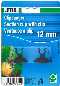
JBL Ventouse à clips 12 mm

Ventouses en caoutchouc pour objets de diam. 12mm