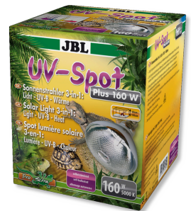
JBL UV-Spot plus

Spot halogène à spectre complet de lumière naturelle