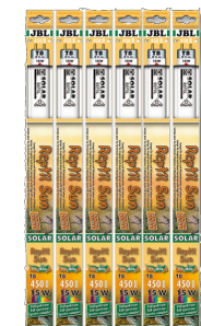
JBL SOLAR REPTIL SUN T8

Tube T8 de terrarium pour animaux des déserts