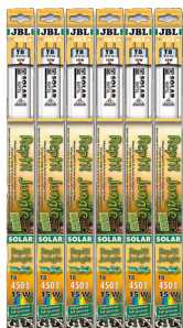
JBL SOLAR REPTIL JUNGLE T8

Tube T8 de terrarium pour animaux de forêts tropicales