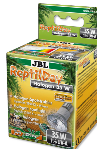
JBL ReptilDay Halogène

Spot halogène à spectre complet de lumière naturelle