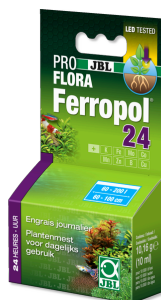
JBL PROFLORA Ferropol 24 Dagelijkse bemesting voor zoetwateraquaria