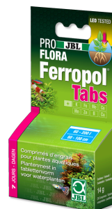
JBL PROFLORA Ferropol Tabs Plantenmest voor zoetwateraquaria