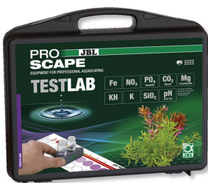
JBL Testlab ProScope Testkoffer voor wateranalyses in plantenaquaria