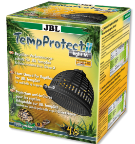
JBL TempProtect II light Protection antibrûlure pour reptiles pour JBL TempSet