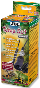
JBL TempSet connect Kit d'installation avec connecteur