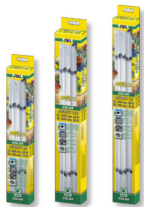
JBL SOLAR Reflect T5/ T8 - 895-1500 mm Reflektorblech für Solar- Leuchtstoffröhre