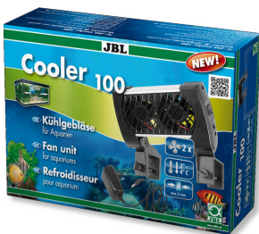
JBL Cooler 100 Koelventilator voor zoet- en zoutwateraquaria