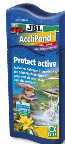
JBL AccliPond Wasseraufbereiter für Teich