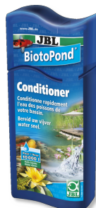
JBL BiotoPond Wasseraufbereiter für Teiche