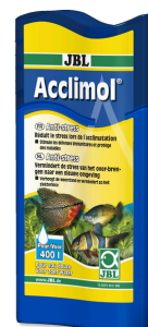
JBL Acclimol Conditionneur d'eau pour l'acclimatation des poissons