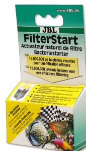
JBL FilterStart Bactéries pour activation des filtres