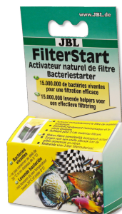
JBL FilterStart Bakterien zur Aktivierung von Filtern