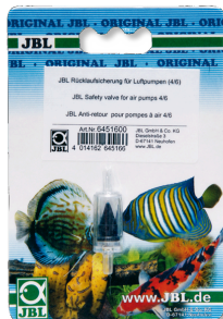
JBL Clapet anti-retour Sécurité antiretour pour pompe à air