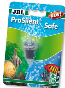
JBL ProSilent Safe Sécurité antiretour