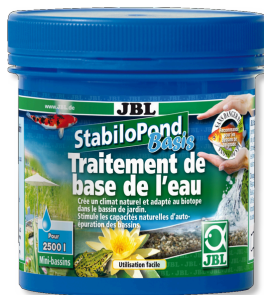
JBL StabiloPond Basis Grundpflegemittel für alle Gartenteiche