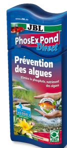
JBL PhosEx Pond Direct Phosphatentferner für Teich