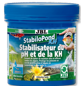
JBL StabliPond KH PH-Stabilisator für Gartenteiche