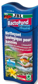
JBL BactoPond Bakterien zur Selbstreinigung vom Teich