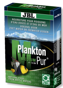
JBL Plankton Pur MEDIUM Friandises pour grands poissons d'aquarium