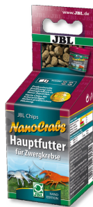
JBL NanoCrabs Hoofdvoer voor dwergkreeften