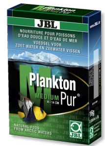
JBL PlanktonPur MEDIUM Lekkernij voor grote aquariumvissen