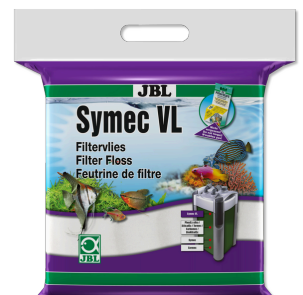
JBL Symec VL Filterwattenvlies tegen alle waterv vertroebelingen