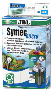
JBL Symec micro Microvlies voor aquariumfilters tegen vertroebelingen