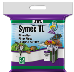
JBL Symec VL Microfibre filtrante contre toutes turbidités de l'eau