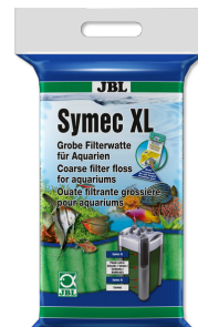
JBL Symec XL Ouate filtrante grossière contre la turbidité de l'eau