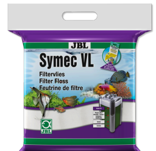
JBL Symec VL Microfibre filtrante contre toutes turbidités de l'eau