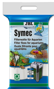
JBL Symec Ouate filtrante Ouate filtrante contre toute turbidité de l'eau