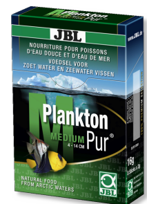
JBL PlanktonPur MEDIUM Leckerbissen für große Aquarienfische