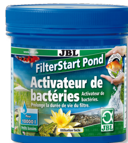
JBL FilterStart Pond Bacteriënfiler voor vijverfilters.