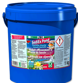
JBL SediEx Pond Bakterien und Aktivsauerstoff zum Abbau von Schlamm