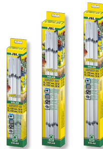
JBL SOLAR Reflect T5/ T8 (895-1500 mm) Réflecteur pour tube fluorescent SOLAR