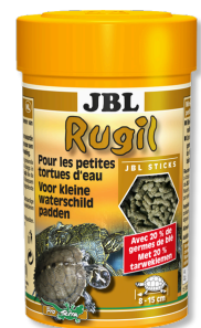
JBL Rugil Primaire voedingssticks voor kleine waterschildpadden