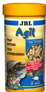
JBL Agil Primair voer voor waterschildpadden van 10-50 cm