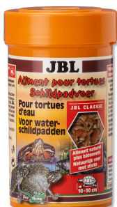
JBL Schildpadvoer Primaire voer met kreeftjes voor waterschildpadden