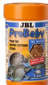
JBL ProBaby Speciaal voer voor jonge waterschildpadden