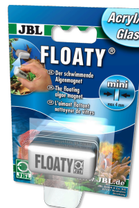
JBL FLOATY Verre/Acrylique Aimant flottant nettoyeur de vitres acryliques