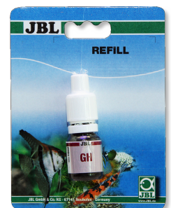
JBL GH test Sneltest voor het bepalen van de gezamenlijke hardheid