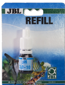
JBL pH 3,0-10,0 Test Schnelltest zur Bestimmung des Säuregehalts