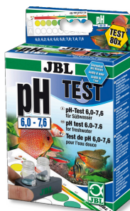
JBL pH 6,0-7,6 Test pH-Test für Süßwasser Aquarien im Bereich 6,0-7,6