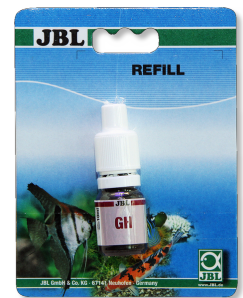
JBL GH test Sneltest voor het bepalen van de gezamenlijke hardheid