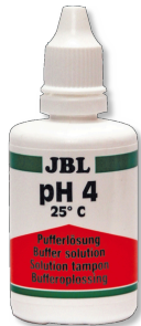
JBL Pufferlösung pH 4,0 Kalibrierflüssigkeit mit pH 4,0 für pH-Elektroden