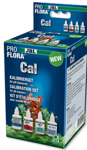
JBL PROFLORA Cal Komplettsset zur Kalibrierung