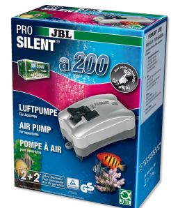
JBL PROSILENT a200 Luchtpomp voor zoet- en zoutwateraquaria