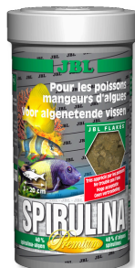
JBL Spirulina Premium Hauptfutter für Algenfresser im Aquarium