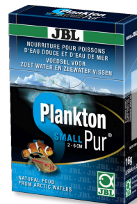
JBL Plankton Pur SMALL Leckerbissen für kleine Aquarienfische