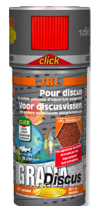
JBL GranaDiscus CLICK Premium-Hauptfuttergranulat mit Dosierer für Diskus