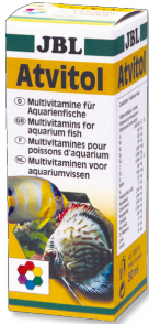
JBL Atvitol Multivitaminropfen für Aquarienfische