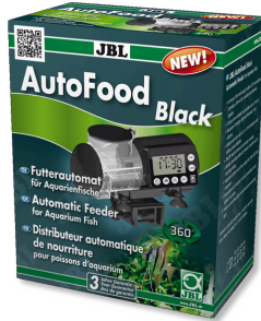
JBL AutoFood BLACK Schwarzer Futterautomat für Aquarienfische