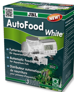
JBL AutoFood WHITE Weißer Futterautomat für Aquarienfische