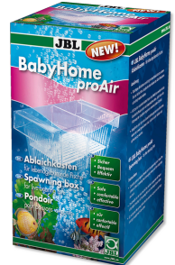
JBL BabyHome proAir Ablaichkasten für Sprudelsteininstallation