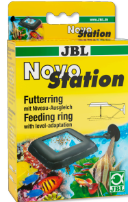
JBL NovoStation Schwimmender Futerring mit Wasserstands-Ausgleich