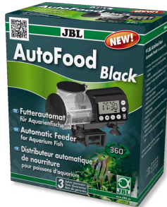
JBL AutoFood BLACK Schwarzer Futterautomat für Aquarienfische