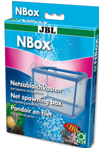
JBL NBox Netzablaichkasten für Aquarienfische