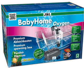
JBL BabyHome Oxygen Premium-Ablaichkasten- Komplettsset mit Luftpumpe