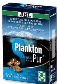
JBL PlanktonPur SMALL Leckerbissen für kleine Aquarienfische