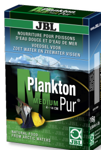
JBL PlanktonPur MEDIUM Leckerbissen für große Aquarienfische