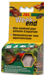
JBL Weekend Aliment complet de week-end pour poissons d'aquarium