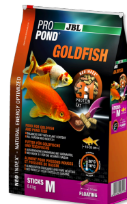
JBL PROPOND GOLDFISH M Bâtonnets pour poissons rouges moyens ou grands