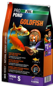
JBL PROPOND GOLDFISH S Bâtonnets pour petits poissons rouges