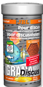
JBL GranaDiscus Premiumvoer in granulaatvorm voor discusvissen