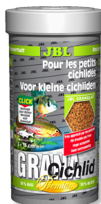
JBL GranaCichlid Premium granulaat voor roofzuchtige cichliden