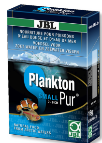
JBL PlanktonPur SMALL Lekkernijen voor kleine aquariumvissen