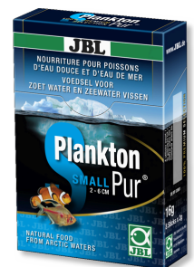
JBL PlanktonPur SMALL Leckerbissen für kleine Aquarienfische