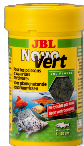
JBL NovoVert Primair vlokvoer voor plantenetende aquariumvissen