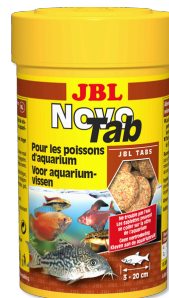
JBL NovoTab Hauptfuttertablette für alle Aquarienfische