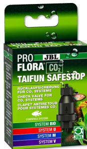
JBL PROFLORA CO2 TAIFUN SAFESTOP Wasserrücklaufsicherung für CO2-Anlagen