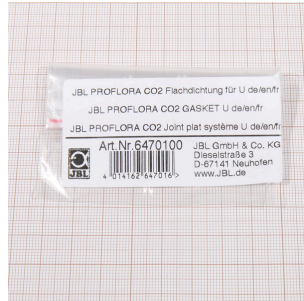
JBL PF CO2 Flachdichtung für U