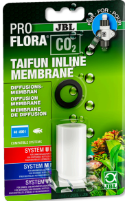
JBL PROFLORA CO2 TAIFUN INLINE MEMBRANE

Austauschmembran für CO2 TAIFUN INLINE Diffusor