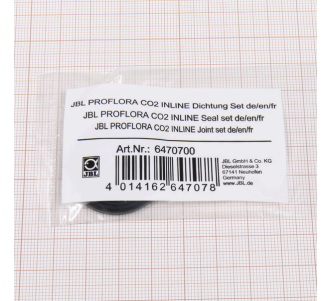
JBL PF CO2 INLINE Dichtung Set