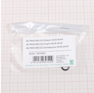
JBL PF CO2 O-Ring für VALVE