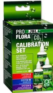
JBL PROFLORA CO 2 CALIBRATION SET Zur Kalibrierung und Aufbewahrung von pH- Elektroden