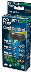
JBL PROTEMP CoolControl

Thermostat zur Steuerung von Kühlgebläsen